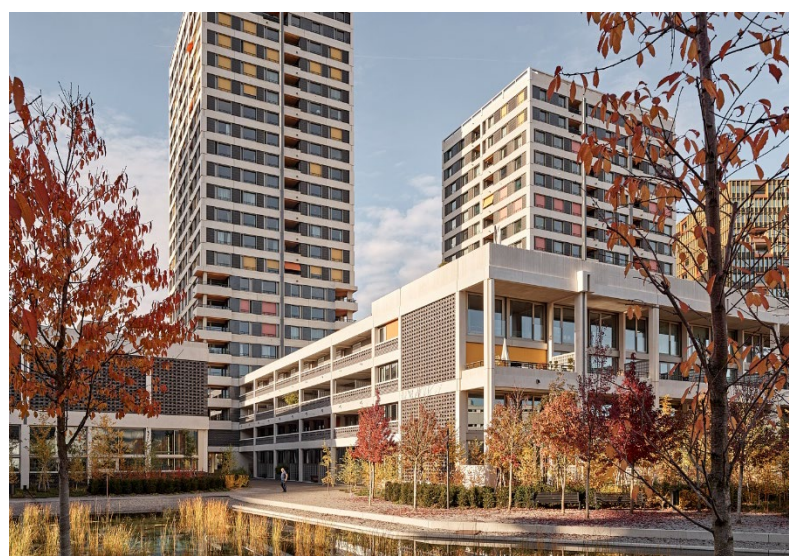
WolkenWerk, Zürich